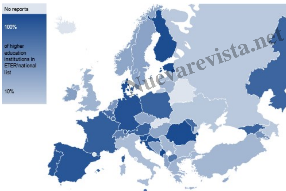
Ilustración 2. Cobertura del sistema de educación superior en DEQAR

Esta brecha es lo que DEQAR se propuso cerrar al proponer una ventanilla única accesible y comprensible para todos. En septiembre de 2020, DEQAR incluye 52.320 informes de garantía de calidad de 34 agencias diferentes, que cubren 2.535 instituciones de educación superior en toda Europa. Hasta ahora, 18 sistemas de educación superior están cubiertos por DEQAR, lo que significa que DEQAR tiene informes sobre al menos el 50% de las instituciones del país ; la ilustración 2 muestra la cobertura de DEQAR en detalle.