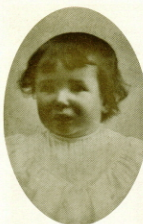
A los dos años de edad. Barbastro, 1904.

El Opus Dei habría de ser, necesariamente, porque son así las cosas en que intervienen los hombres, una organización —una desorganizada organización dijo en alguna ocasión el fundador—, y, sobre todo, un mensaje, que era a la vez viejo por evangélico, y nuevo por olvidado