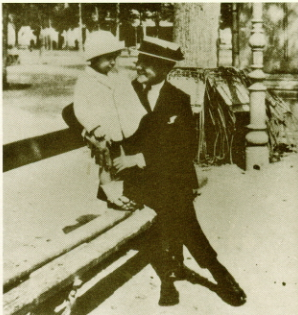
Logroño, 1918 y 1919.

A partir de la década cincuenta, Mons. Escrivá promovió la creación de centros universitarios en diferentes lugares del mundo, respecto de los cuales ejercería las funciones históricas, más reales que simbólicas, de Gran Canciller. La primera de esas Universidades fundada en 1952, fue la de Navarra