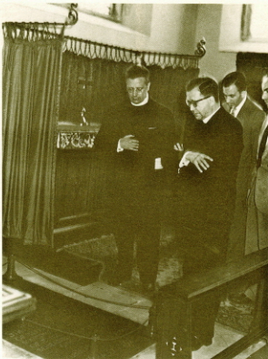
Canterbury, 1962. Ante la tumba de Sto. Tomás Moro.

Fueron más de mil trescientos los cardenales, arzobispos y obispos que se dirigieron a la Santa Sede con escritos postulatorios. Lo cual representaba una tercera parte larga de la Jerarquía de todo el mundo