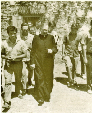
En México. Año 1972.

En 1934 Escrivá publicó en una modesta imprenta de la ciudad castellana de Cuenca sus