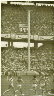
Los atletas compiten junto a la antorcha Olímpica que preside los juegos.

— En cuanto al gigantismo alcanzado por los juegos, parece pedir una reforma o reducción del número de participantes, lo cual iría en contra del aumento normal de atletas, como consecuencia del crecimiento demográfico y del desarrollo mundial del deporte. En los Juegos de Moscú 1980 los participantes fueron 5.872; los organizadores de Barcelona han declarado las dificultades que tienen para acoger en la villa olímpica, prevista para 15.000 personas, a cerca de 20.000, entre participantes, entrenadores y jefes de misión. Para no ir contra una evolución normal que justifica este aumento, y no caer, sin embargo en el gigantismo, C. Fleuridas y R. Thomas ( Los Juegos Olímpicos , 1984) recogen algunas de las soluciones propuestas, que si no resultan plenamente satisfactorias, permitirían mejorar sensiblemente las condi-