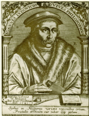
Vives. Grabado firmado por Edmond de Boulonois.

Los cuatro ejercieron una poderosa influencia en las ideas, en las conductas, en el estilo cultural y hasta en la política de su tiempo. Vives y Erasmo no ocuparon cargos públicos, pero Budé fue lo que hoy se llamaría ministro y Moro, jefe de gobierno. Los