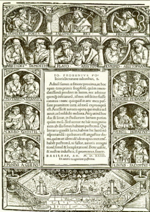
Portada de los Adagia de Erasmo según la edición de Froben de 1523.

Luis Vives significa nuestra dimensión europea y la modernidad cultural