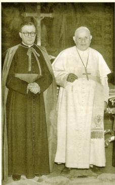
Con S.S. el Papa Juan XXIII.

En este sentido, como resulta obvio, la santidad es una realidad mucho más amplia y dilatada que la connotada por esos actos, y procesos a los que conocemos con los nombres de beatificación y canonización, con los que pasamos del nivel ontológico—lo que unas determinadas vidas han sido real y fácticamente— al público, eclesiológico o social. Toda beatificación, las muchas que han tenido lugar en tiempos y años pasados y la que tendrá lugar el 17 de mayo, nos sitúan ante una realidad fáctica, ante un hecho o, por mejor decir, ante una persona—en este caso Mons. Josemaría Escrivá de Balaguer— de quien se afirma que objetiva y realmente ha sido fiel al ideal cristiano, encarnándolo en su vida. A la vez, e inseparablemente, ante el reconocimiento de ese hecho, y un reconocimiento solemne, realizado por la comunidad cristiana a través de quienes la representan. Las beatificaciones, en efecto, no son un acto privado, sino un acto de la Iglesia como tal. De ordinario suelen estar precedidas de un periodo en el que la persona o personas a las que se refieren han suscitado admiración e incluso han sido objeto de devoción popular, más o menos extendida según los casos, pero cuando tiene lugar la beatificación—y más aún esa segunda declaración solemne que es la canonización—se da, para la conciencia creyente, un sal-