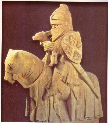
Caballero medieval (siglo XIV).

Antes de su celebración en Madrid fue presentada en Gante durante el pasado otoño, dentro de Europalia 91 y en Oporto a lo largo de los primeros meses de este año. Con la etapa madrileña, que se cerrará el día 26 de julio, terminará el ciclo viajero de la exposición que volverá entonces a Portugal, dispersándose, tras una última escala, de nuevo en Oporto, este irrepitible conjunto de obras de arte, códices, documentos y armas, con el que se obtiene una visión casi total de la