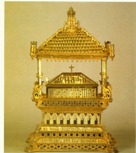
Relicario. (Siglo XIII).

La última parte de la Exposición está dedicada a la entronización de la Casa de Avis y a la consagración del Reino portugués como entidad política independiente dentro del conjunto peninsular, ligado estrechamente a la política europea a través de la Alianza de Inglaterra mediante el Tratado de Windsor (1386), que figura también en la Exposición, y el matrimonio de la Infanta, Isabel de Portugal, con Felipe el Bueno, Duque de Borgoña. Los demás hijos de Juan I de Portugal, «La ínclita generación» de Camoens, están también representados en este capítulo, en el que se pone asimismo de mani-