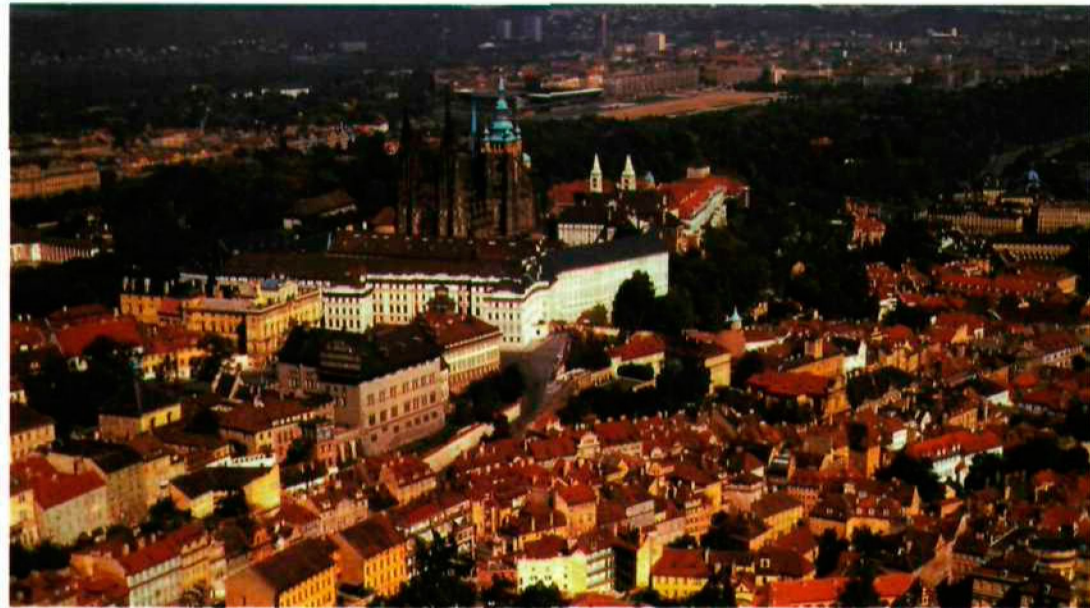
Vista de Praga.