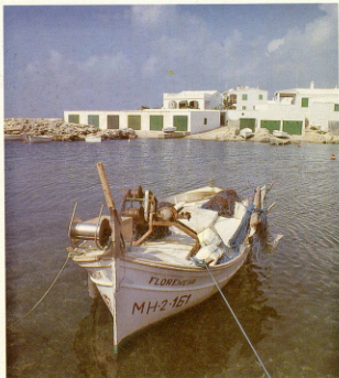
barios y catálogos de la flora menorquina.

Los primeros estudiosos de origen menorquín no aparecen hasta las últimas décadas del siglo XVIII. Profesionalmente son médicos y farmacéuticos, cuyos intereses se centran mayormente en el campo de la botánica, y consecuentemente se dedican a la elaboración de her-