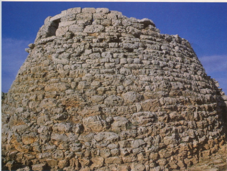
Menorca guarda restos arqueológicos de antiguas culturas.