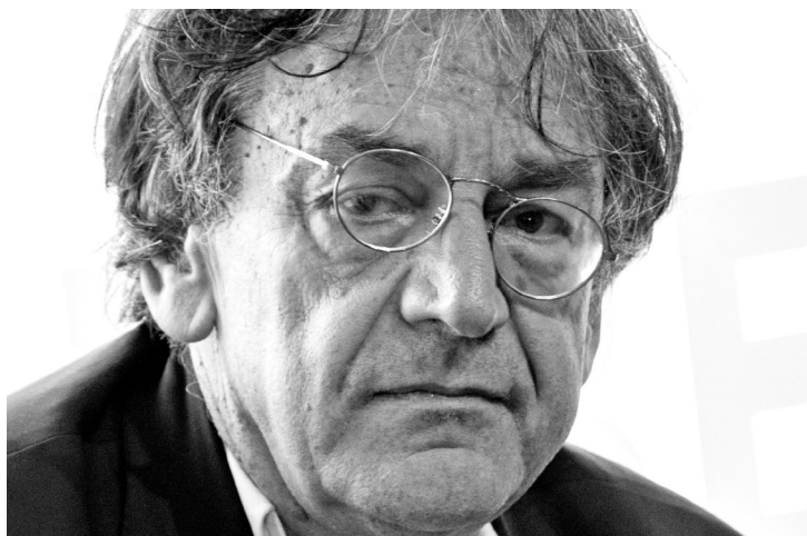
Alain Finkielkraut en 2013.