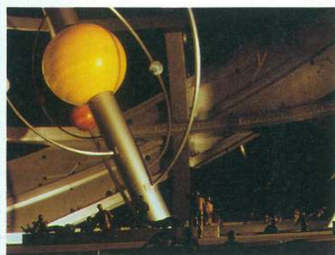
Maqueta de la Esfera Armilar. Detalle.