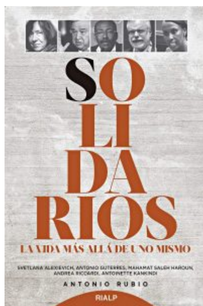
Solidarios. Rialp. 2021. 168 págs. 12 €

El alma humana, en sus profundidades más dramáticas o entrañables, vive en las páginas de sus obras La guerra no tiene rostro de mujer y Últimos testigos . A mi modo de ver, el espíritu de esta segunda obra es el mismo que envuelve a la obra de Dostoievski , que no concebía la propia felicidad, o incluso la armonía eterna, si para asegurarla hubiera que derramar una sola lágrima de un niño inocente. No existe ningún progreso, ni tampoco ninguna revolución, que pueda justificar esa lágrima. El niño siente que hay guerra cuando papá no está y pasará mucho tiempo esperando a que vuelva. La guerra y sus secuelas en forma de atrocidades contra la población civil arrebatarían la infancia a quienes después fueron hombres y mujeres.