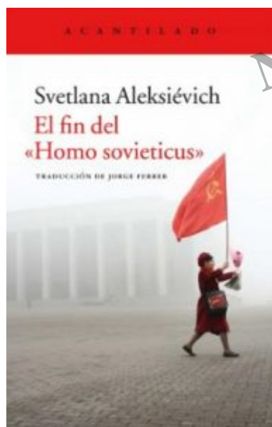
El fin del Homo sovieticus. Acantilado. 2015. 656 págs. 23,75 €

El fin del “Homo sovieticus” (2013) arranca de la muerte del imperio de los soviets entre lágrimas y maldiciones , pero los argumentos sobre el socialismo no murieron con esa desaparición. El hombre soviético se resistió a morir. El propio padre de la autora creyó en el comunismo hasta el final de su vida, y muchos de sus amigos también. Llegaron incluso a admitir que, si bien habían conocido el estalinismo, este no era auténtico comunismo. El comunismo constituía toda la existencia de aquellas personas. El comunismo era una religión secular con su propia concepción del bien y del mal. Sus partidarios integraron tanto su ideal en la vida de las personas que resultaría casi imposible de arrancar.