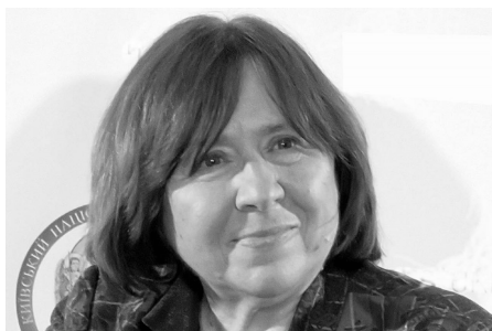
Svetlana Alexievich, historiadora de las voces anónimas