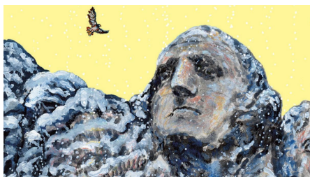
«Sé mía», de Richard Ford