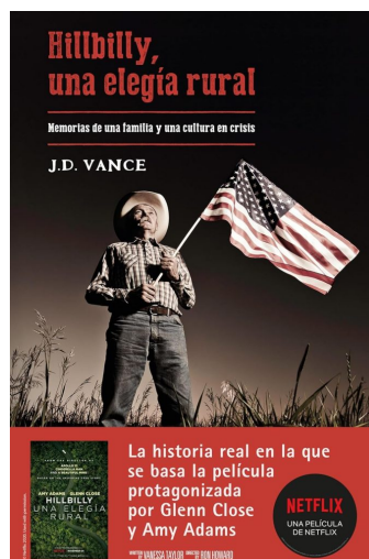
J. D. Vance: «Hillbilly, una elegía rural». Deusto, 2017

Trump barajó diversos aspirantes a la hora de decidir su candidato a vicepresidente, pero al final eligió a un compañero de campaña que se hizo famoso como tribuno de la base política del propio Trump. J. D. Vance, senador republicano por Ohio, es autor de otra excelente autobiografía, Hillbilly Elegy (traducida como Hillbilly, una elegía rural ), en la que también explora su propia identidad. «Me identifico con los millones de estadounidenses blancos de clase trabajadora y ascendencia escocesa-irlandesa que no tienen título universitario», escribió Vance. «Los estadounidenses los llaman paletos, palurdos o basura blanca ».