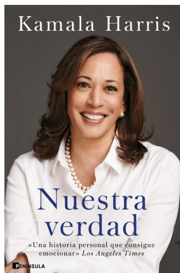
Kamala Harris: «Nuestra verdad». Península, 2021

Este es el terreno resbaladizo que pisa la vicepresidenta Kamala Harris como candidata demócrata. En virtud de su identidad —de varias de sus identidades— podría hacer historia: la primera mujer presidenta, la primera mujer y negra presidenta, la primera presidenta indio-estadounidense. Pero, ¿convertirá esto su candidatura en el desafío ideal a la de Trump, o en su rival ideal? Algunos republicanos ya la llaman «la contrata DEI», en referencia a la diversidad, la equidad y la inclusión.