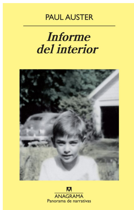
Paul Auster: «Informe del interior». Anagrama, 2013