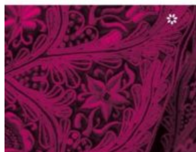
Juan Belmonte, matador de toros (Libros del Asteroide), 376 págs.

Porque quijotesco es el humor de Manuel Chaves , el continuo errar de la juventud belmontiana, la Sevilla —¿o debería escribir la Triana?— que fue durante siglos y ya nunca volverá. Una España de picaresca actualizada pero no por ello exenta de ternura, provista de una brava dignidad en la lucha diaria ante la que hoy es difícil reconocerse.