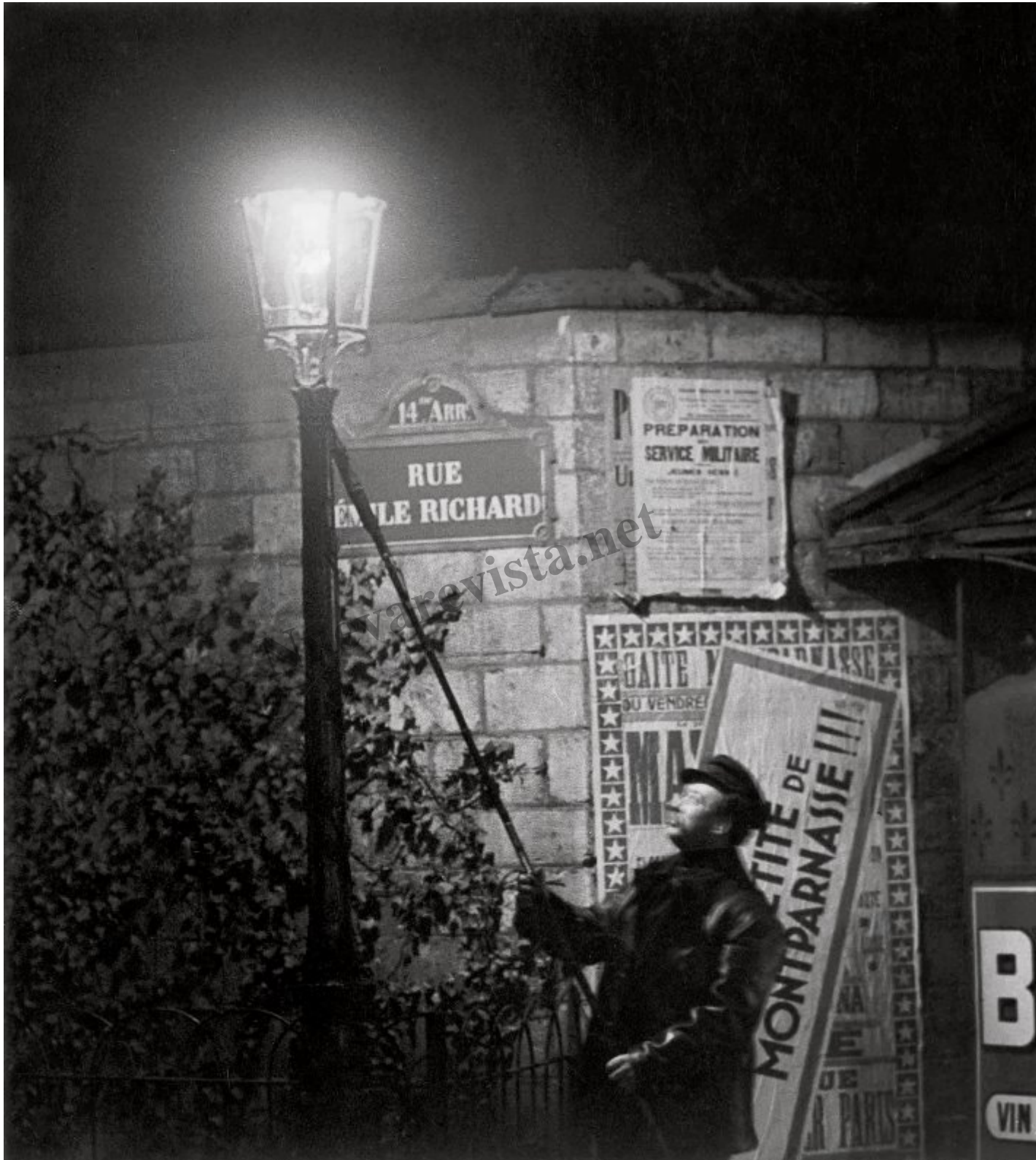
Brassai Extinguishing a Streetlight, rue Émile Richard. c. 1932